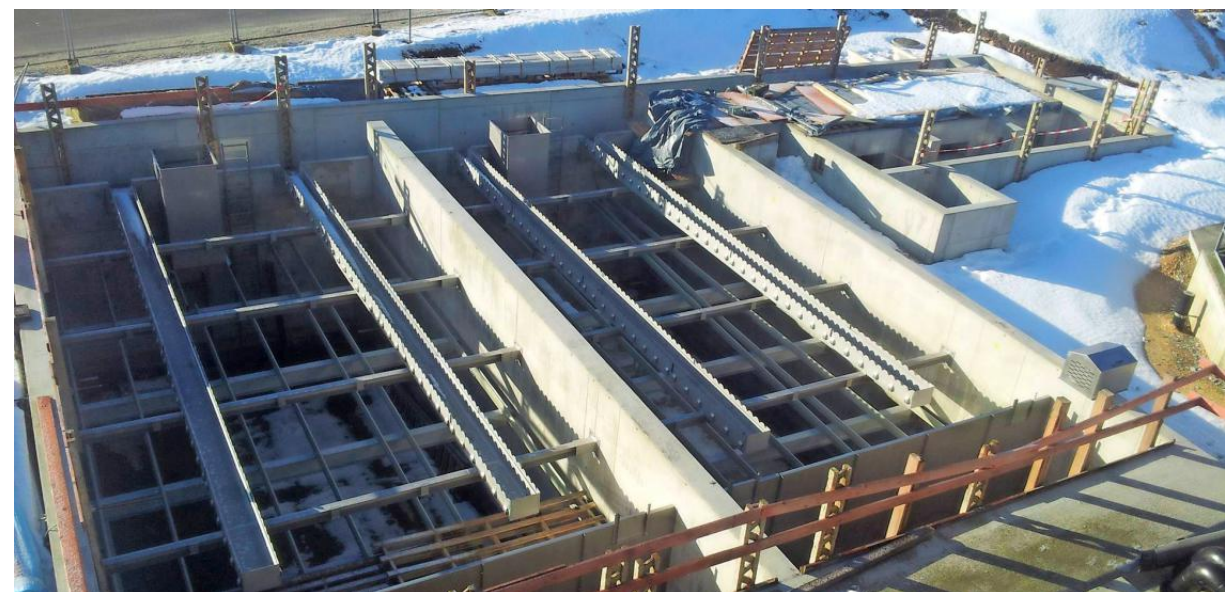
Bauphase im Winter: Im Rohbau sieht man die beiden Sedimentationsbecken (links) und hinten rechts den Rohbau für den Tuchfilter. Laichingen wird als erste Kommune im Alb-Donau-Kreis eine Kläranlage mit Spurenstoff-Filter haben.

Damit soll gewährleistet sein, dass ein guter chemischer Zustand der Oberflächengewässer in den EU-Staaten für diese Stoffe bis 2021 erreicht wird. (raab)